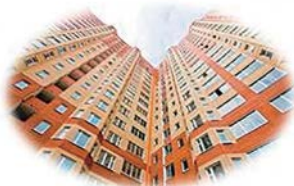
квартиру на вторичном рынке