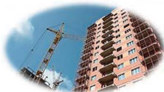
квартиру по договору участия в долевом строительстве