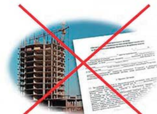
приобретение жилья по договору переуступки прав требования