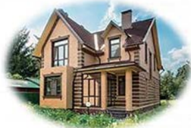
жилой дом с земельным участком